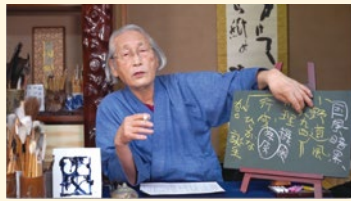
板書を用いてわかりやすく講義