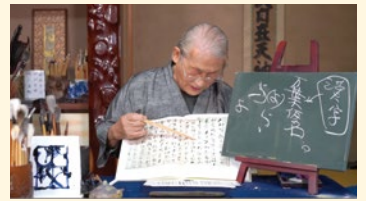
図を示しながらこまかく解説