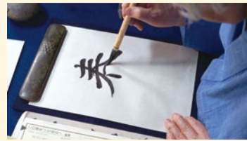
筆の動きがよくわかる臨書